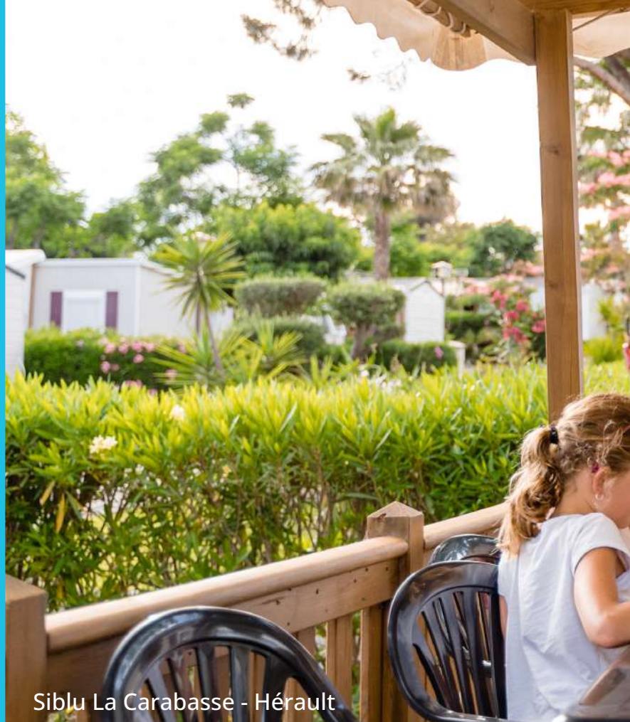
Siblu La Carabasse - Hérault

Faites bénéficier à vos salariés et ayants droits du meilleur prix garanti