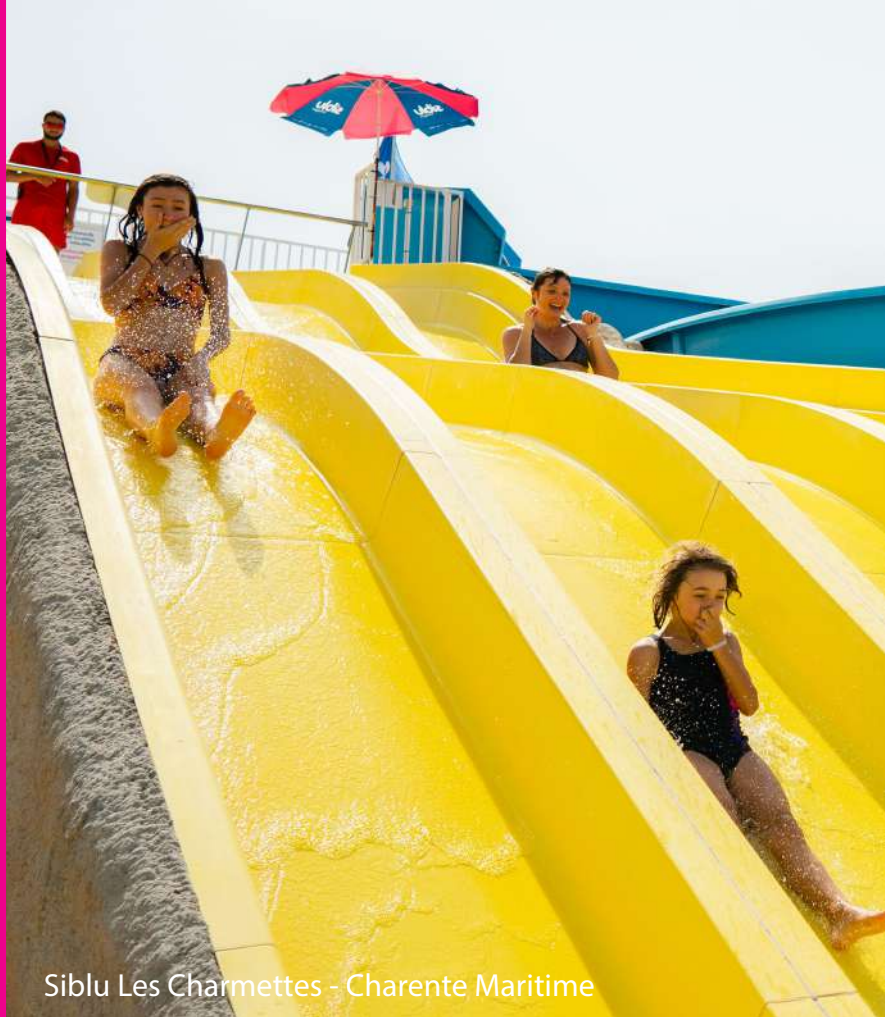
Siblu Les Charmettes - Charente Maritime